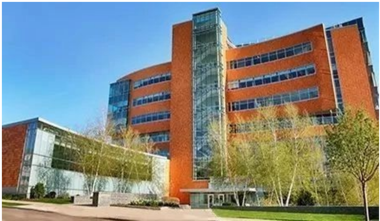
梅奥健康生活中心

健康生活中心 (Healthy Living Center) 提供的高管健康管理计划(Healthy Living Program)源于梅奥几十年健康管理经验，打造个性化、增强健康、延长寿命的系列方案。包括：