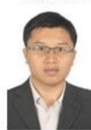
河南大学 万绍渊 教授