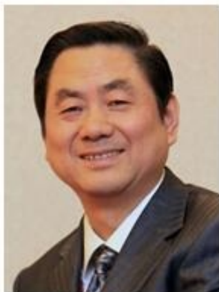
空军军医大学 陈志南 院士