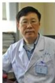
河南省医学科学院 郭永军 教授