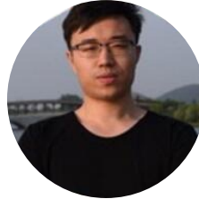
于翔 新浪微博 新浪微博