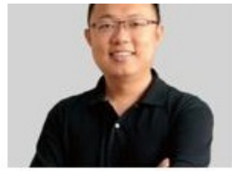
合享汇智信息科技有限公司 总裁 专利情报、科技创新情报专家