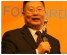
中国科技信息研究所研究员 情报学教授，产业竞争情报专家