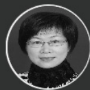
徐菁 中共霞浦县县委常委