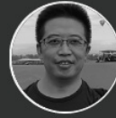
余霄 中国贵州航空工业集团 董事长