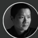
骆丹 中国当代摄影新锐