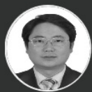
令狐绍辉 遵义市旅游发展委员会主任