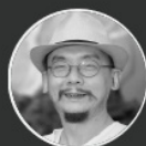
陈可之 当代著名油画家/国画家/书 法家