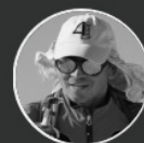
金飞豹 著名探险家