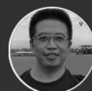
余霄 中国贵州航空工业集团 董事长