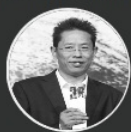
肖锋 甘孜藏族自治州旅游发展委 员会主任