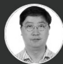
杨波 都江堰市旅游局局长