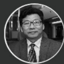
陈欣 三明市政协副主席、三明市 旅游发展委员会主任