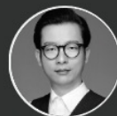
潘越飞 《财经》 掌门人