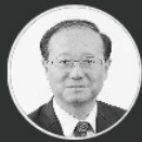
邵琪伟 国际山地旅游联盟副主席 原国家旅游局局长