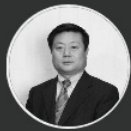
傅迎春 国际山地旅游联盟 执行秘书长 原贵州省旅游局局长