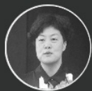
曹泓 舟山市旅游委员会主任