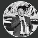
阿夏永红 玉树藏族自治州旅游局局长