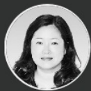
高晓春 成都温江区旅游局局长