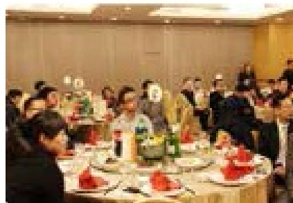
Dinner Sponsor 晚宴赞助