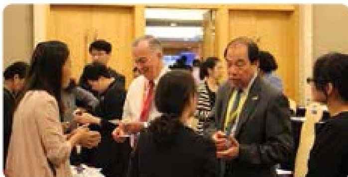
Business Networking 商务交流