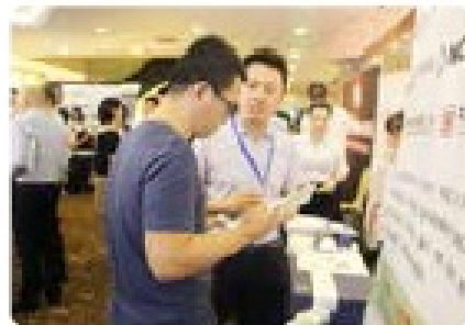
Exhibition Visit 展位咨询