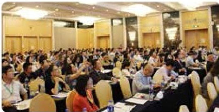
Main Conference 会议现场