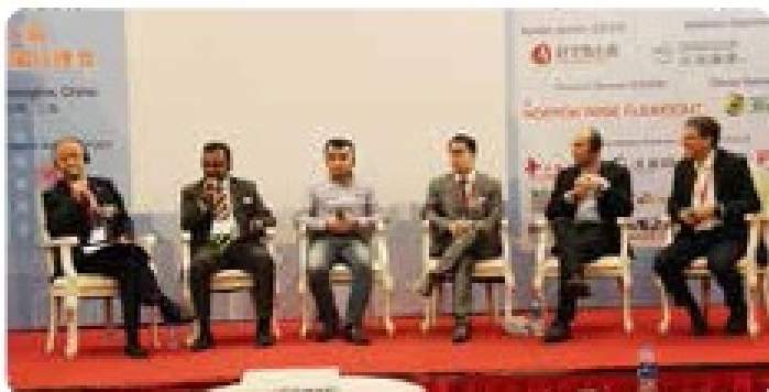
Panel Discussion 高层对话