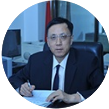
李德 中国人民银行 参事,中国人民银行研究局...