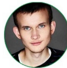
Ethereum Founder Vitalik Buterin