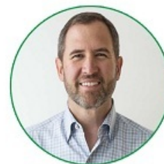
Ripple CEO Brad Garlinghouse