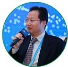
数字货币研究所所长 姚前