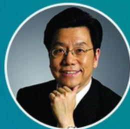
李开复 (拟邀) 创新工场