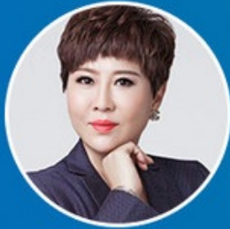
周丽霞 (拟邀) 金慧丰投资