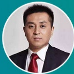
付岩 (拟邀) 中青创投