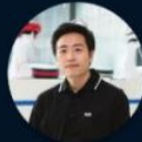
柔宇科技创始人 刘自鸿