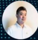
科大讯飞执行总裁 胡 郁