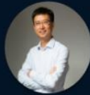
阿里云 总裁 胡晓明