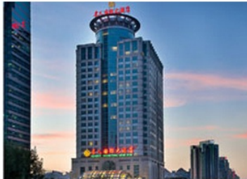
北京名人国际大酒店