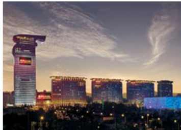
北京盘古七星酒店