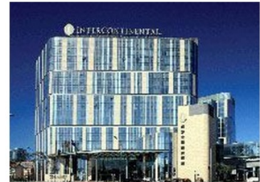
北京北辰洲际酒店