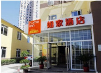
如家快捷北京水立方体育馆店