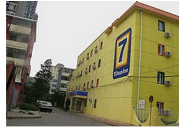
7天连锁酒店北京北沙滩店