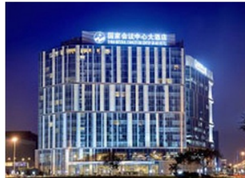
北京国家会议中心大酒店

地址：北京市朝阳区北辰西路8号院1号楼(鸟巢西北角)(酒店距会场的距离约300米)