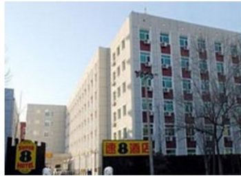
速8酒店北京学院路店