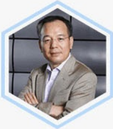
徐少春 金蝶软件集团 董事局主席