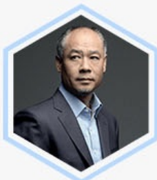
李宁 著名企业家 李宁品牌创始人