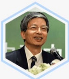
蔡国雄 北京市政协 副主席