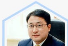
徐少春 金蝶软件集团 董事局主席