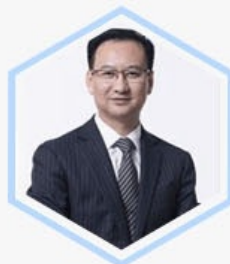
冷箫 论坛 创办人、秘书长