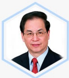
刘明康 银监会 原主席