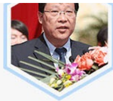
吴国华 浙江省十一届人大 常委副主任