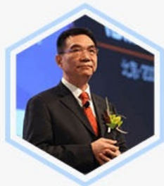
林毅夫 全国工商联副主席、 世界银行前第一副行长