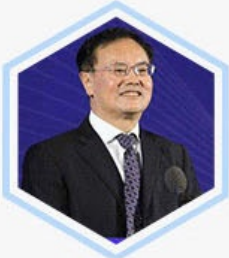
庄聪生 全国工商联 副主席