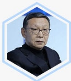
蔡鄂生 中国银监会原副主席 亚洲金融协会主席