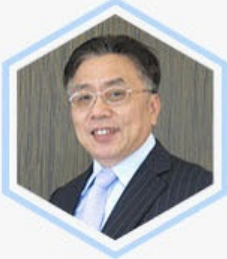
郭山辉 台商领袖 全国台企联会长