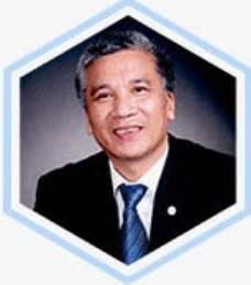
丁仲礼 中国科学院副院长 民盟中央副主席