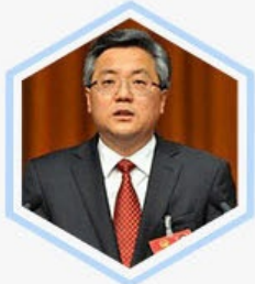
周红波 南宁市人民政府 市长