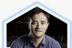
胡跃飞 平安银行 行长