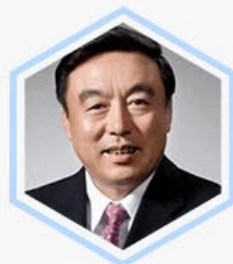
马蔚华 招商银行 前行长