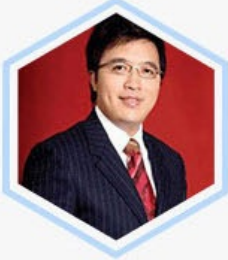
马志毅 全国青联副主席 澳门马万祺家族第三代...