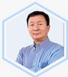
刘建军 招商银行 副行长