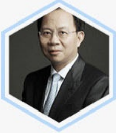
邱晓华 原国家统计局局长 民生证券首席经济学家