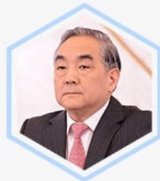
杨凯生 经济学家、 中国工商银行前行长