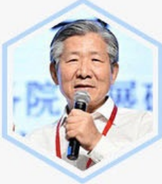
侯云春 国务院发展研究中心 副主任