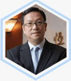
施荣怀 全国政协委员、中华厂... 恒通资源集团执行董事