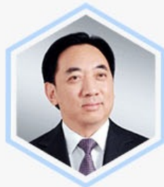
倪泽望 深创投 董事长