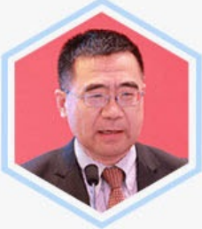
李耀 世界银行集团·IFC亚洲区 首席投资官