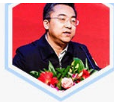
郑勇男 北京市工商联 副主席