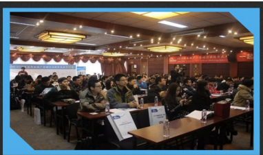
首届中国网络营销行业大会现场