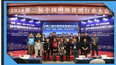
第二届中国网络营销行业大会部分合照