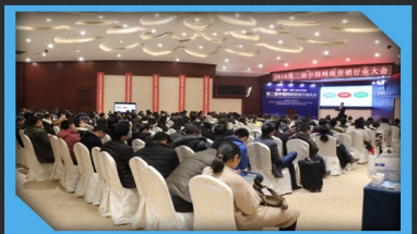
第二届中国网络营销行业大会现场