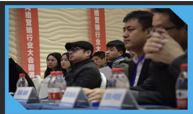
首届中国网络营销行业大会现场