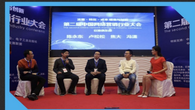
第二届中国网络营销行业大会论坛现场