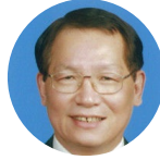
王战 上海社会科学院 院长