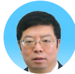
邱勇 清华大学 校长