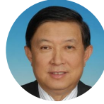
徐冠华 浦江创新论坛 主席