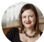
Tanya Monro 南澳大学研究与创新中心 副校长