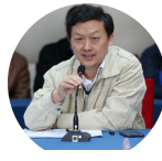
沈建强 多伦多总领馆 科技参赞