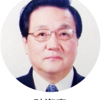
孙海鹰 前陕西省科技厅 厅长