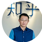
周源 知乎 CEO