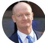
David Willetts 英国前大学 科学国务大臣