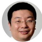
江南春 分众传媒 董事长