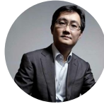
马化腾 腾讯集团 董事局主席