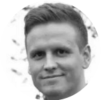
爱东 ( Arto mustikkaniemi... 芬兰驻中国大使馆 科技参赞