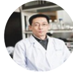
施一公 美国科学院 院士