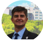
Yury Gogotsi 美国艺术与科学院 院士