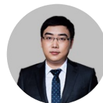
程维 滴滴出行 CEO