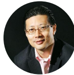
沈南鹏 红杉资本中国基金 创始人