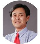
洪宰珉 韩国科学技术研究院研究... 院长