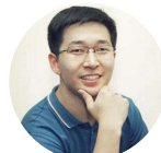
戴威 ofo共享单车 创始人兼CEO