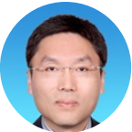
李平 科技日报社 社长