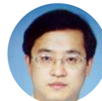
余继军 人民日报文化传媒有限公司 董事长