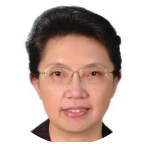
吕薇 国务院发展中心创新... 部长