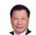
应勇 上海市 市长