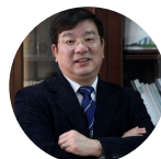
赵东元 中国科学院 院士