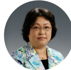
罗晖 中国科协创新战略研究院 院长