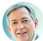
Reinhold Achatz 德国蒂森克虏伯集团 首席技术官