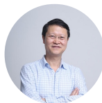
张俊 华为 原副总裁