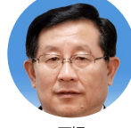
万钢 全国政协 副主席