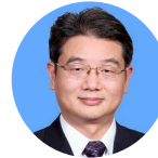
胡志坚 科学技术部中国科学技术... 院长