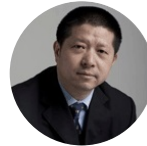
裘新 上海报业集团 党委书记