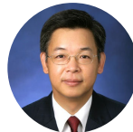
黄益平 北京大学国家发展研究院 副院长