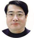
高海浩 浙江日报报业集团 社长