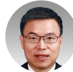
方世忠 徐汇区 区长