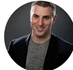
Brian Chesky 美国Airbnb 创始人