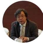
吴志强 同济大学 副校长