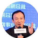
刘松 阿里巴巴集团 副总裁