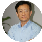
樊建平 中国科学院深圳先进技术... 院长