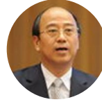
戴厚良 中国石油化工股份有限公司 高级副总裁