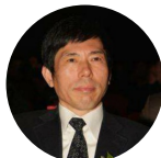
杨咸武 科技部高新技术发展及产... 副司长