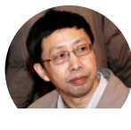
武夷山 中国科学技术发展战略研... 副院长