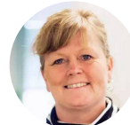
Charlotte Brogren 瑞典创新局 局长