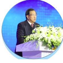
龙永图 博鳌论坛 秘书长