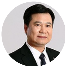
张近东 苏宁云商集团 董事长