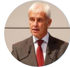
穆勒 大众汽车 全球CEO