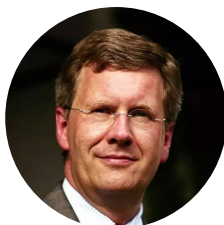
武尔夫 德国前总统