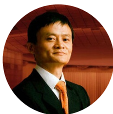
马云 阿里巴巴 董事局主席