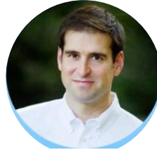
斯特劳贝尔 斯特拉 联合创始人