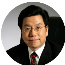
李开复 创新工场 董事长