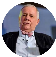
吉姆·罗杰斯 量子基金 创始人