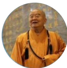
星云大师 佛光会 创始住持