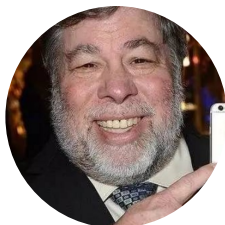
沃兹尼亚克 苹果公司 联合创始人