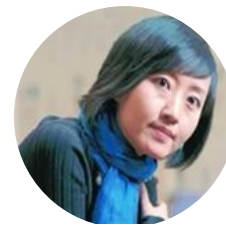
柴静 央视年度十佳主持人” 知名记者