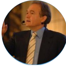
约翰格雷 斯特拉 心理学博士、两性关系第...