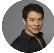
李连杰 太极禅实践学堂 创办人