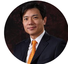
李彦宏 董事长兼CEO 百度公司