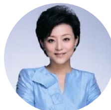
杨澜 阳光媒体集团 董事局主席