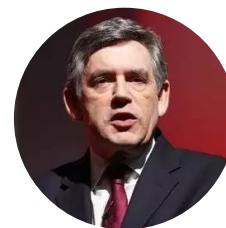
戈登·布朗 英国前首相