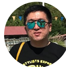
和君 tutorabc(原vipabc) 大前端负责人