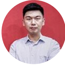
徐立 商汤集团 CEO