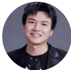
王伟 白夜追凶 导演