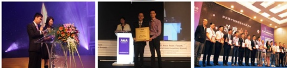
(上图“2017中国未来商业银行趋势峰会”奖项名称)

中国商业银行业该如何应对金融科技带来的挑战和竞争？如何通过战略布局、经营策略、风险管理流程及技术框架的搭建和全面创新来拥抱新技术？如何塑造面向未来的核心竞争力？