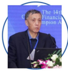
李德, 中国人民银行参事、中国人民银行研究院原副局长