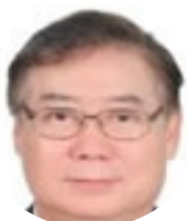
楊寧蓀 台湾农业生物技术研究中心 特聘教授