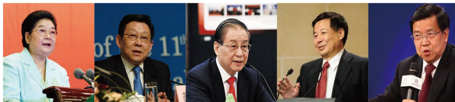
陈秀莲 第十届全国人大常委会副委员长 中国关心下一代工作委员会主任 陈德铭 商务部原部长 海峡两岸关系协会会长 刘明康 全国政协经济委员会副主任委员 中国银监会原主席 朱光耀 中国财政部副部长 龙永图 原国家外经贸部副部长 博鳌亚洲论坛原秘书长