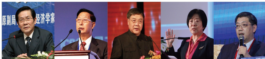
贺铿 十一届全国人大常委 财经委副主任 徐锡安 新华社党组副书记 常务副社长 张志刚 商务部原副部长 吴晓灵 全国人大常委会、财经委副主任委员 清华大学五道口金融学院院长 巴曙松 中国银行业协会首席经济学家 香港交易所首席中国经济学家