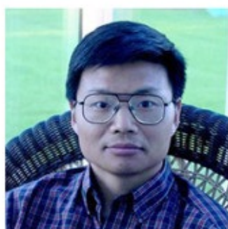
鄂维南 中国科学院院士