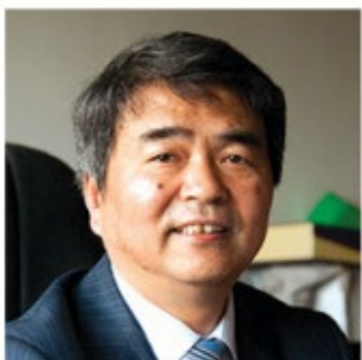
谭建荣 中国工程院院士