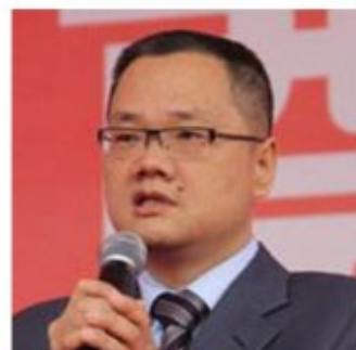
彭政纲 恒生电子董事长