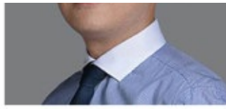
张俊 拍拍贷创始人