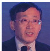
于学军 银监会 国有重点金融机构 监事会主席