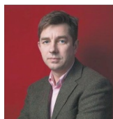
胡润 胡润百富 董事长兼首席调研员