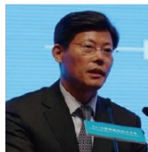
宣昌能 证监会 主席助理