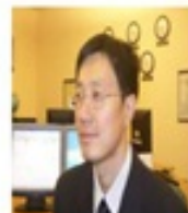
健建 中国区代表 International Retailer