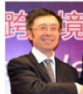
汤兵勇 中国跨境电子商务应 用联盟主席