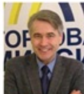
Igor Subow 邮政物流委员会主席 俄罗斯远程贸易协会 NAMO