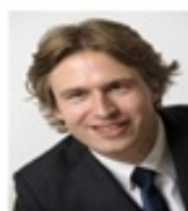
GJUS OP DE WEEGH 首席运营官 Payvision