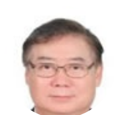
楊寧蓀 台湾农业生物技术研究中心 特聘教授