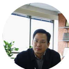
徐晓 共青团中央书记处 书记