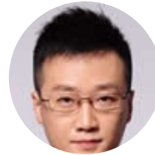
严楷晨 中国教育电视台 主持人