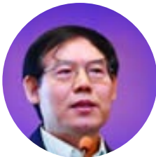
邓天佐 科技部资源配置与管理司 副巡视员