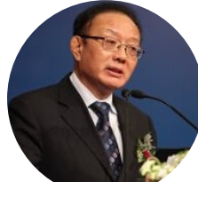
魏建国 中国国际经济交流中心 秘书长