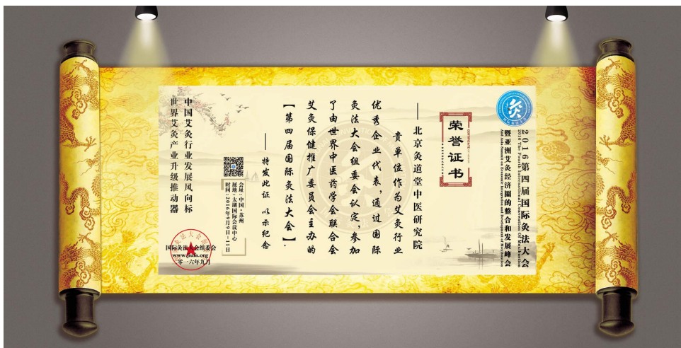
第四届国际灸法大会·第3天议程