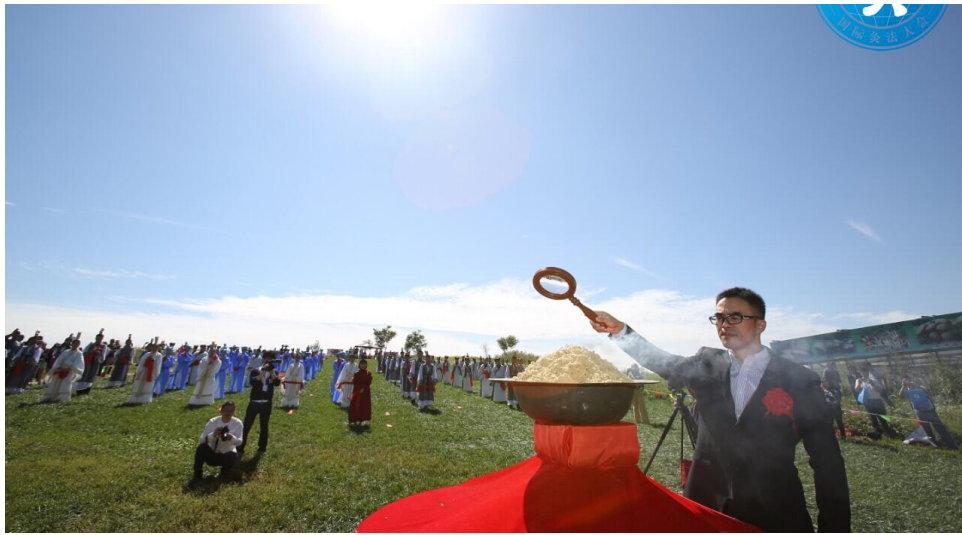
艾灸与美容抗衰老主题论坛 2016年09月10日 下午