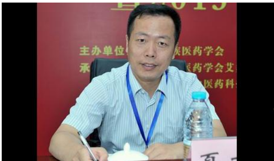
夏友兵：承淡安与澄江针灸学派

的十年时间里，除去函授学生，共培养针灸学员达千名。1954年，承淡安被任命江苏省中医进修学校校长，为国之瑰宝针灸医技的复兴奋斗终生。（CCTV10《人物》20160519 大国医 承淡安）。