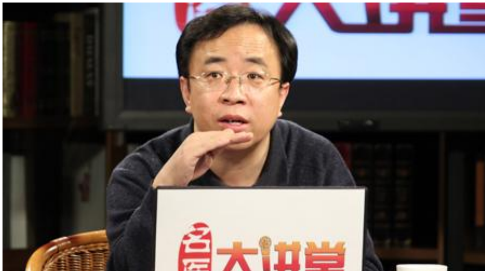
黄金昶：肿瘤疾病如何艾灸