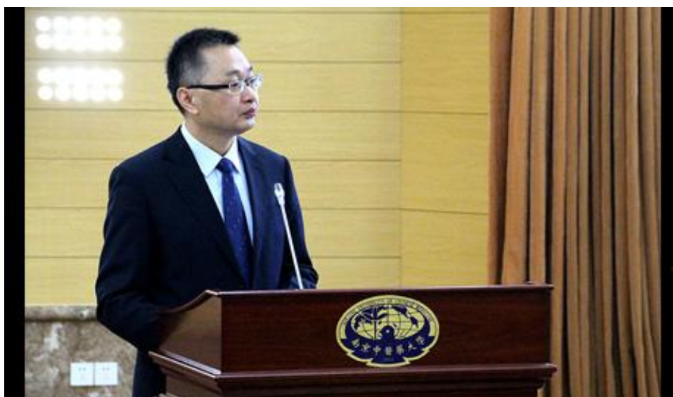
张建斌：承淡安游学经历及对中国灸法的贡献

夏有兵：教授、博士研究生导师。南京医科大学副校长、中国针灸学会常务理事，中国针灸学会流派研究与传承专业委员会主任委员，中国中医药学会医史文献专业委员会常务理事，江苏省针灸学会副会长。主要研究针灸及中医流派研究与传承，针灸辅助生殖临床效应及机理研究。现主持国家自然科学基金课题2项。专著《承淡安研究》一书于2012年荣获江苏省哲学社会科学二等奖。