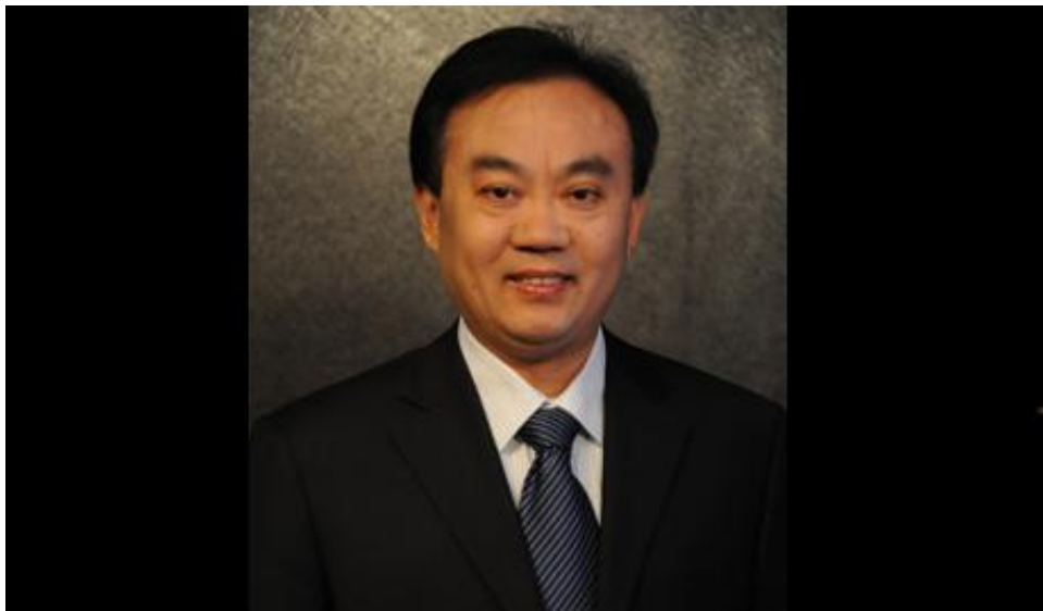
赵立冬:艾灸文化产业园运营模式浅析