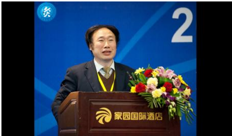
吴焕淦：论艾烟和艾火的临床作用