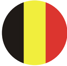
Deneffe 比利时驻香港大使 比利时驻香港大使