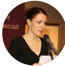
齐丽 大使 匈牙利驻华