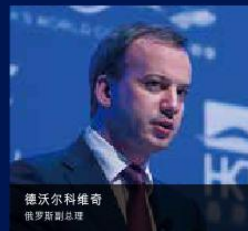
德沃科维奇 俄罗斯副总理