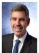
埃利安 安联集团首席经济顾问; 奥巴马总统全球发展委员会主席; 纽约时报两本畅销书作者; 太平洋投资管理公司前行政总裁兼联席投资总监