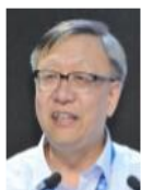
柴洪峰 中国银联股份有限公司执行副总裁