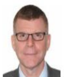
史蒂芬·P·格罗夫 亚洲开发银行东亚局、东南亚局和太平洋局副行长