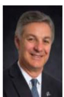
雷蒙德·康纳 波音公司副主席