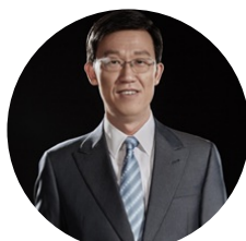
贺志强 联想集团高级副总裁 首席技术官