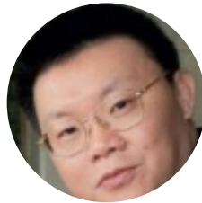
龚虹嘉 海康威视 副董事长