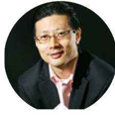
沈南鹏 红衫资本中国基金 创始人