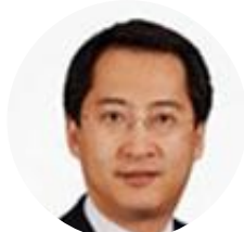
刘海峰 KKR 大中华区总裁