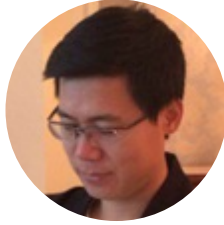
王刚 滴滴打车 天使投资人