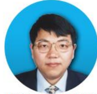
同济大学交通运输工程 学院院长 孙立军