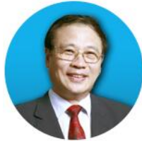
中国科学院院士 褚君浩