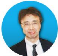
日本丰田都市交通研究 所教授 安藤良辅