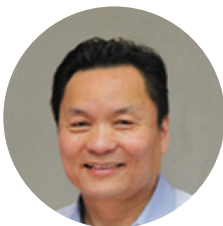
钱忠直 国家药典委员会 首席专家