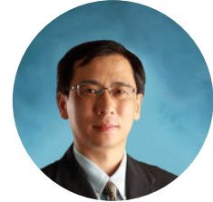
姜志宏 澳门科技大学 副校长