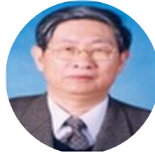
刘昌孝 中国工程院 院士