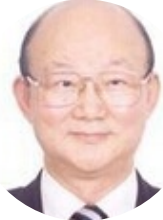
周宏灏 中南大学 院士