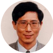
陈凯先 中国科学院院士 上海市科协主席