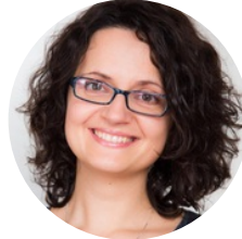
Krystyna Skalicka-Woźniak 波兰卢布林医科大学 教授