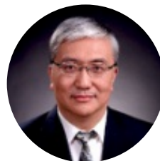
唐旭东 中国中医科学院西苑医院 院长