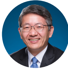
卞兆祥 香港浸会大学 协理副校长