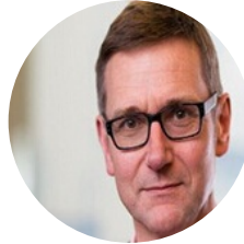
约翰铂尔曼 路透社 记者