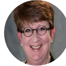
卡罗尔凯思琳 美联社 高级副总裁