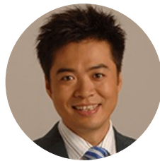
段暄 中央电视台 著名主持人