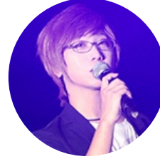
河童 诗图天下 CEO