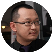
梧桐 诗图天下 VP