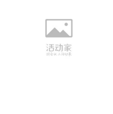
汪阔 LAYABOX 副总裁