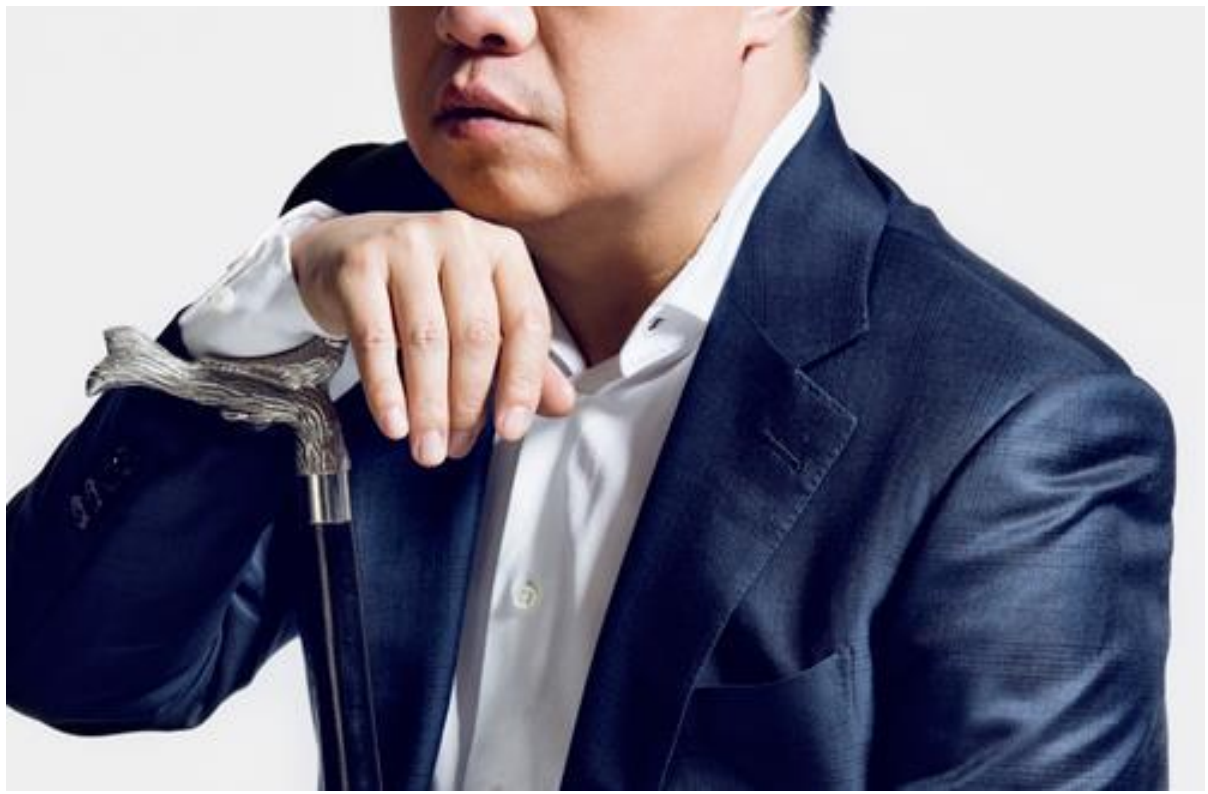
米未传媒CEO马东（拟邀）

前爱奇艺首席内容官，电视人，电视节目主持人，毕业于北京电影学院。曾先后就职于湖南电视台、中央电视台等。