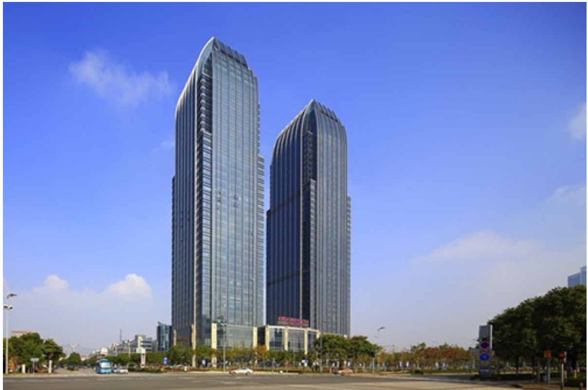
无锡太湖皇冠假日酒店

无锡太湖皇冠假日酒店是无锡地区新晋入驻的国际品牌五星级酒店。酒店拥有300间设施齐全的客房和套房；无锡唯一一家五星级意大利餐厅，提供经典意式美食，以及设施先进的健身中心和动感时尚的运动酒吧；选择多样、功能齐备的宴会及会议设施，其中包括可以轻松容纳500人的太湖宴会厅，600M 2 的宴会前厅，另有九间面积从68M 2 至538M 2 的多功能厅及小型会议室。