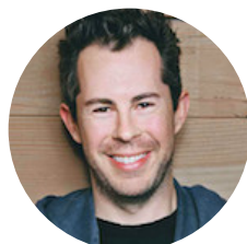
Bill Google 联合创始人