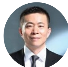
曹国伟 新浪 首席执行官/总裁