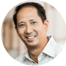
Ping Accel 合伙人