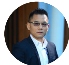
盛希泰 洪泰基金 创始人