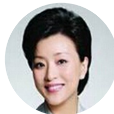
杨澜 阳光传媒 总裁