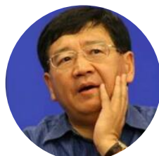
徐小平 真格天使投资基金 创始人