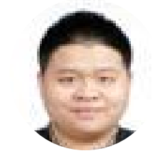
景一 汉景家族办公室 总裁