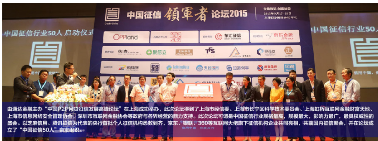
由通达金融主办“中国P2P网贷征信发展高峰论坛”在上海成功举办，此次论坛得到了上海市经信委、上海市长宁区科学技术委员会、上海虹桥互联网金融财富天地、上海市信息网络安全管理协会、深圳市互联网金融协会等政府与各界经营的鼎力支持。此次论坛可谓是中国征信行业规格最高，规模最大，影响力最广，最具权威性的盛会。以芝麻信用、腾讯征信为代表的央行首批个人征信机构悉数到齐，京东、银联、360等互联网大佬旗下征信机构企业共同亮相，共襄国内征信聚会，并在论坛成立了“中国征信50人”自发组织。