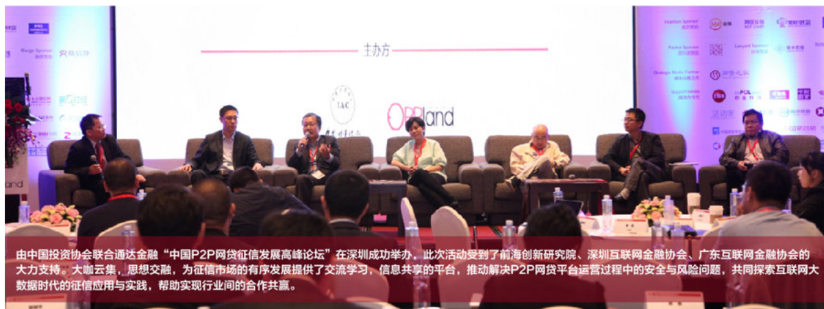
由中国投资协会联合通达金融“中国P2P网贷征信发展高峰论坛”在深圳成功举办。此次活动受到了前海创新研究院、深圳互联网金融协会、广东互联网金融协会的大力支持。大咖云集，思想交融，为征信市场的有序发展提供了交流学习，信息共享的平台，推动解决P2P网贷平台运营过程中的安全与风险问题，共同探索互联网大数据时代的征信应用与实践，帮助实现行业间的合作共赢。