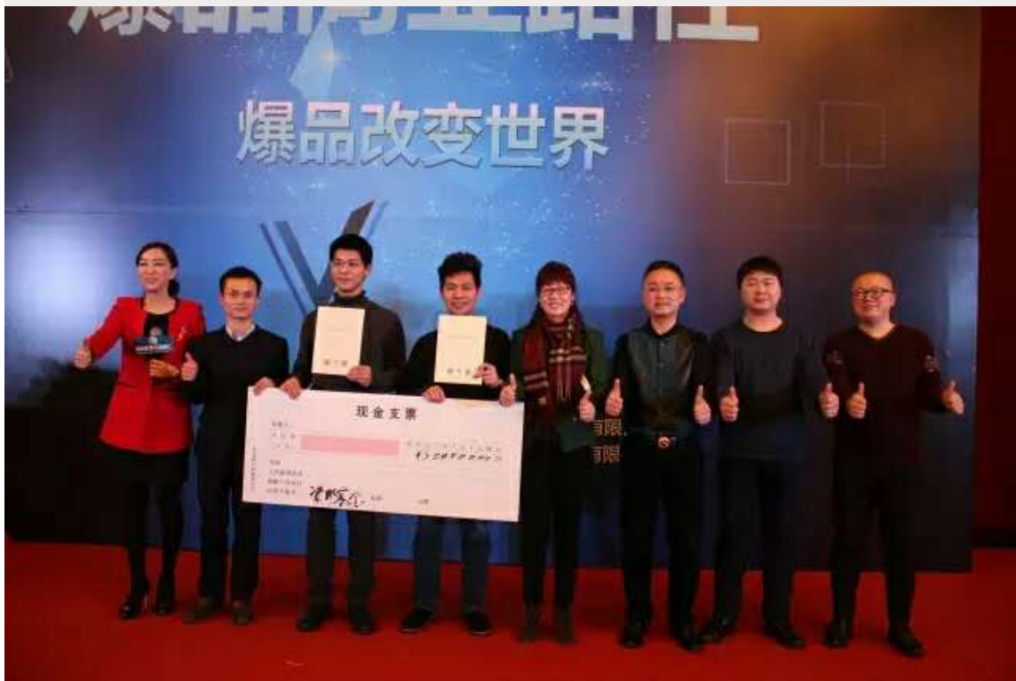
现场项目路演第三名获300万意向投资资金。