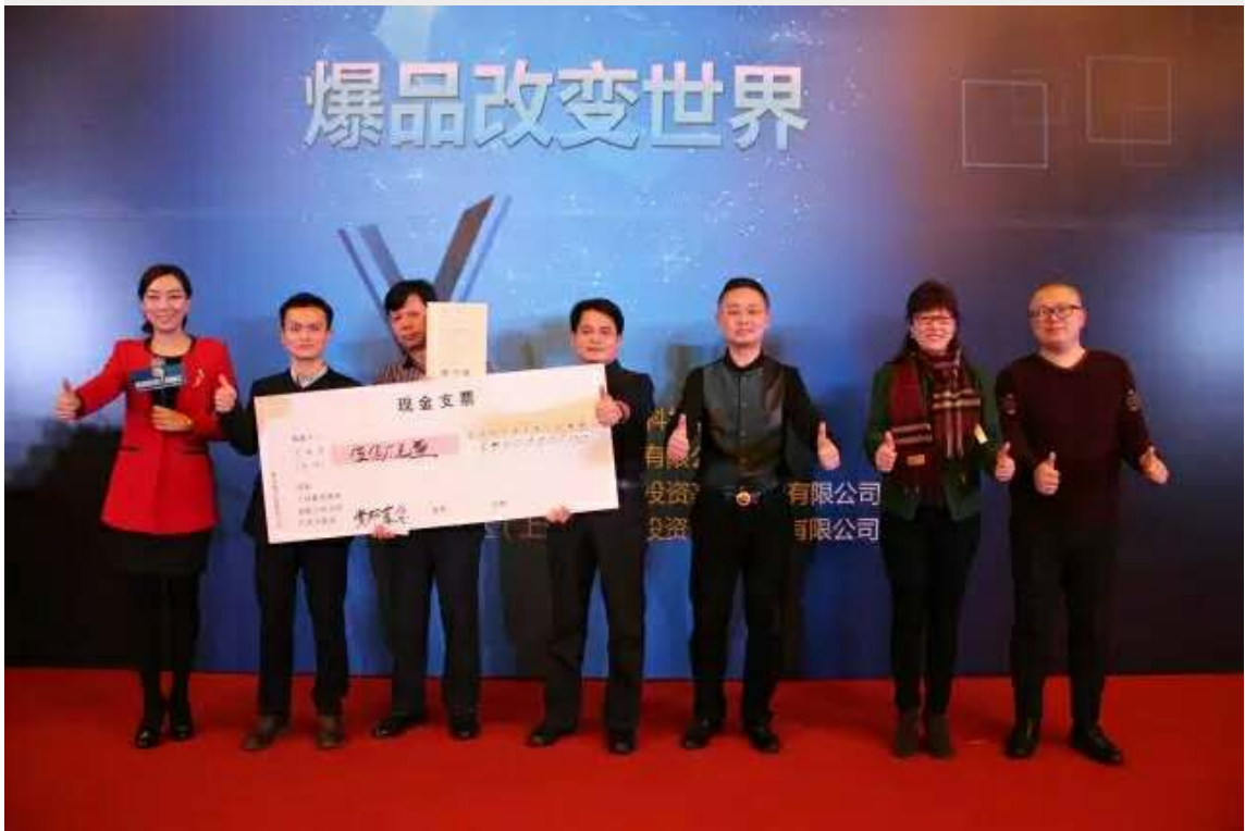
现场项目路演第二名获500万意向投资资金。