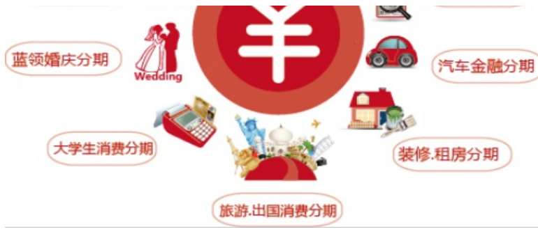
(图注：各大垂直细分消费场景)