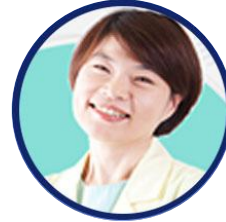
李ANNA 最高整形外科医院院.. 大韩整形外科医师会..