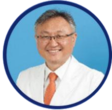
权宁大 江南三星整形外科医.. 大韩整形外科医师会..