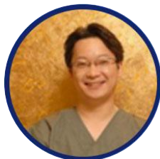
朴准 starline整形外科医院 大韩整形外科医师会..