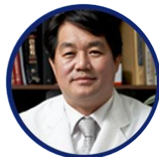
金荣镇 整形外科医院院长 大韩整形外科医师会..