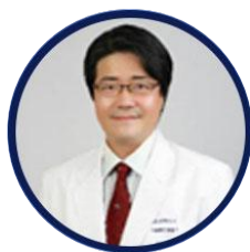
车知熏 GIO整形外科医院院... 大韩整形外科医师会..