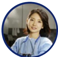
NAMIN-WHA Yerom整形外科医院.. 大韩整形外科医师会..