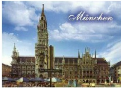
慕尼黑-德国经济、文化与科技中心