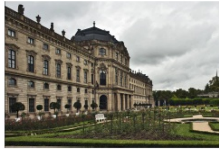
德国最美皇宫-维尔茨堡