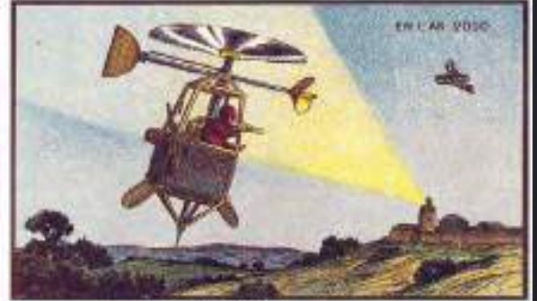
Airship Instead of a Helicopter