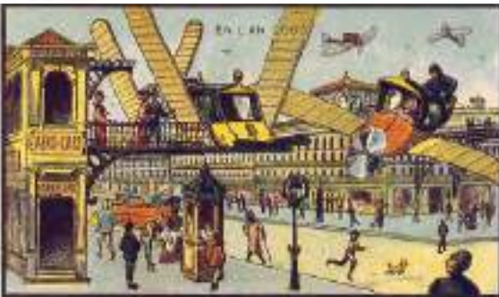
Aerial Cab Station