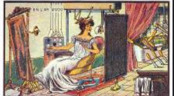
Motion of Her Toilet