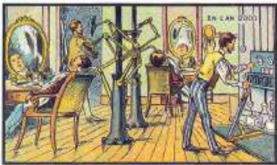
The New-Invented Barber