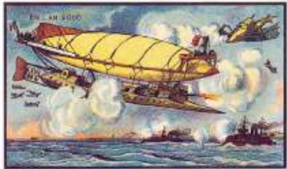
An Aerial Boat