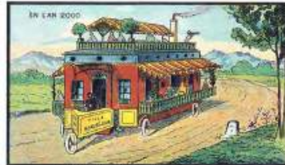
A House Rolling Through the Countryside