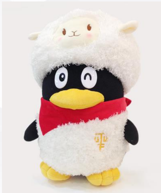
正版企鹅羊年QQ公仔