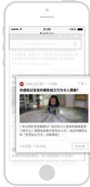
优质信息流导流问答