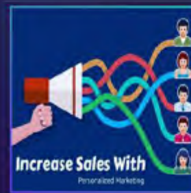
用户需求越来越个性化