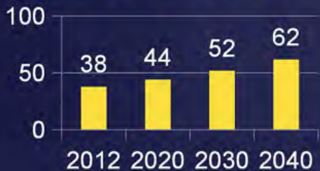
全球死亡人数 (百万)