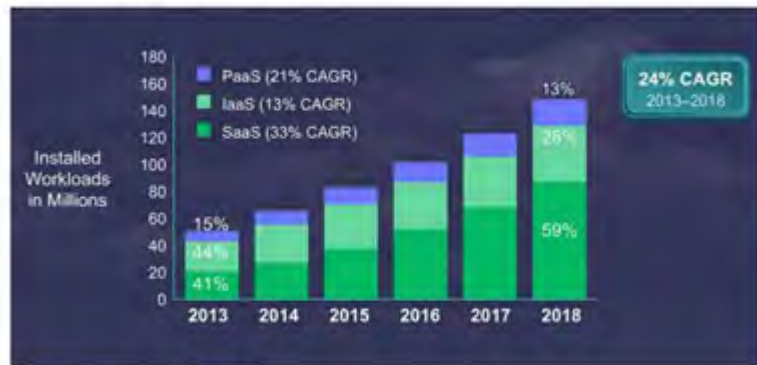
Figure 9. SaaS Most Highly Deployed Global Cloud Service by 2018