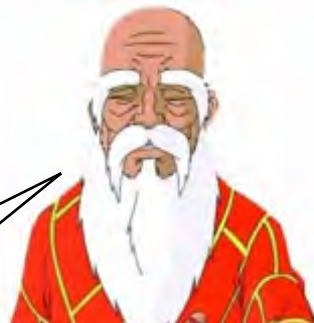
Netflix Adrian Cockcroft

Uh? Do you think Netflix got it right first time? [...] We broke everything until we found a way to get around the problems. We only published the good things. 少年，说多了都是泪啊