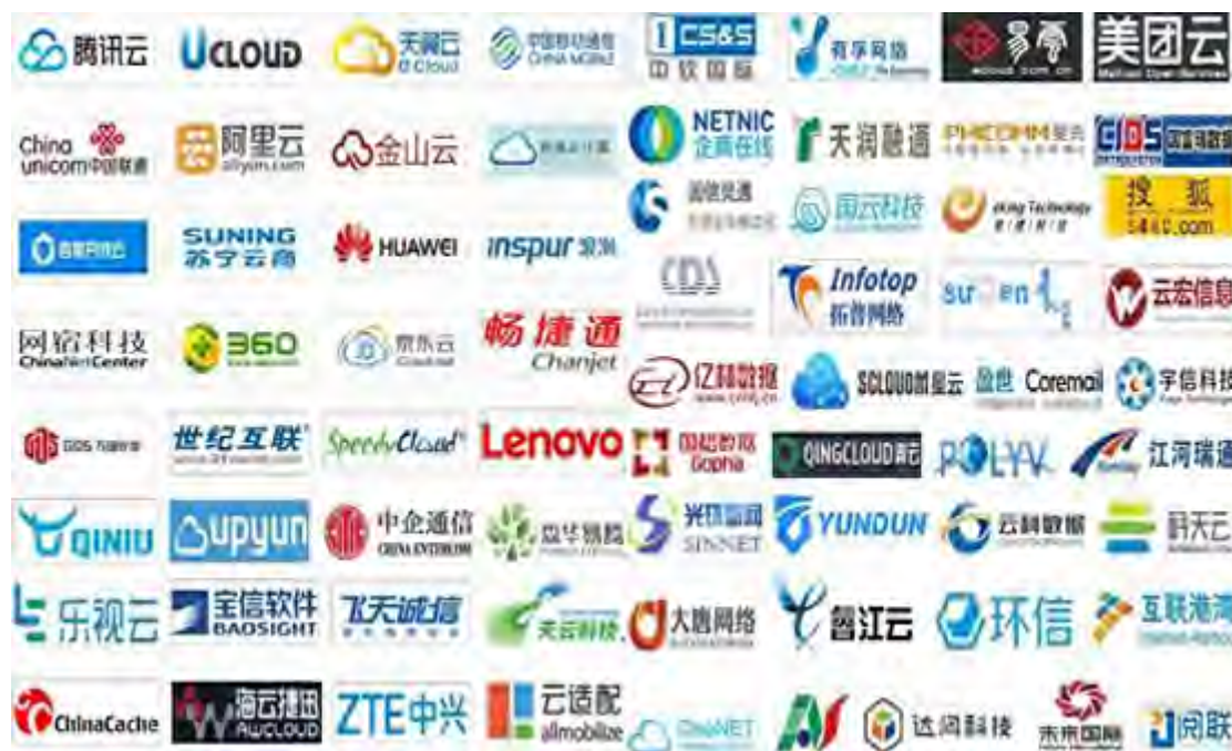
部分通过可信云认证的品牌

目前，近百家已通过可信云认证的云服务商，大部分在申请承保资格，中国信通院正在评估申请企业的风险情况。